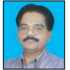
ഫിലി വർക്കി ട്രസ്റ്റി, സെന്റ് മേരീസ് ചർച്ച്