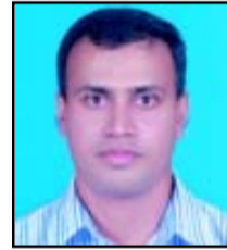
ഏബിൾ പി. സി. സെക്രട്ടറി, സെന്റ് മേരീസ് ചർച്ച്