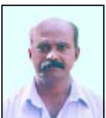
എബ്രഹാം പി. ഐ ഫുഡ്