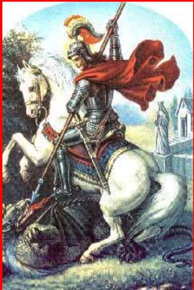
യാക്കോബായ സഭയുടെ ദേവാലയങ്ങൾ പരി. ഗീവറുഗീസ് സഹായയുടെ ഓർമ്മ മേടമാസത്തിൽ കൊണ്ടാടുന്നു. പരി. സഹായയെ തിരഞ്ഞെടുക്കുവേണ്ടി അപേക്ഷിക്കണമേ

യാക്കോബായ സുറിയാനി ക്രിസ്ത്യാനികളുടെ പ്രസിദ്ധീകരണം Vol.1 Issue 5 May. 1 - 15, 2006