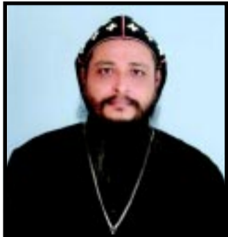
ക്രമീകരണങ്ങൾ പൂർത്തിയാക്കുമെന്ന് സുന്നഹദോസ് സെക്രട്ടറി അഭിവാദ്യം

പാത്രിയർക്കീസ് ബാവയിൽനിന്ന് അംഗീകാരം ലഭിക്കുന്ന മുറയ്ക്ക് പരി.സഭയുടെ ഭരണഘടന അനുശാസിക്കുംവിധം മറ്റ്